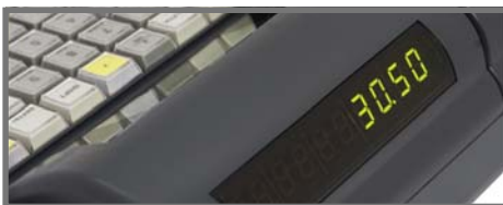
LED KLIENTA DISPLEJS