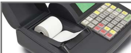
VIENKĀRŠA LENTES MAIŅA