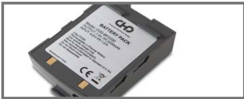
UZLĀDĒJAMS LI-ION AKUMULATORS