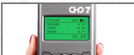
GRAFISKS LCD DISPLEJS