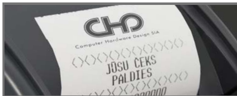
GRAFISKS LOGO UZ ČEKA