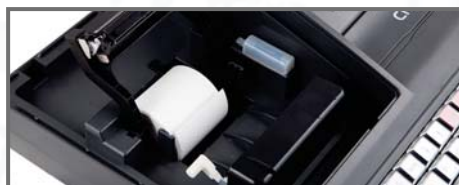
VIENKĀRŠA LENTES MAIŅA