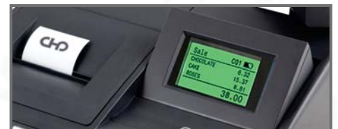
RITINĀMS LCD DISPLEJS