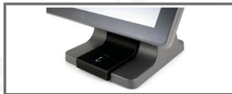
PIRKSTU NOSPIEDUMU LASĪTĀJS VAI I-BUTTON POGA