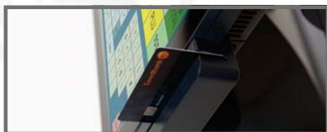
MAGNĒTISKAIS KARŠU LASĪTĀJS