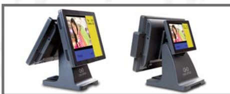
DAŽĀDAS PERIFĒRIJU IEKĀRTAS