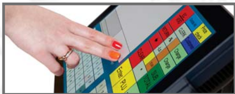
P-CAP MULTI-TOUCH SKĀRIENEKRĀNS

CHD 8700 aprīkots ar īpaši izturīgu korpusu, lai tas nodrošinātu darbu arī sliktos apstākļos.