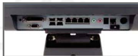
STATĪVS AR ADAPTERA KORPUSU