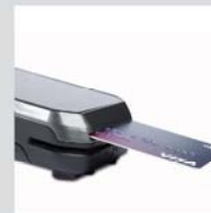
Maksājumu karšu termināls