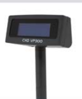
Ārējais klienta displejs